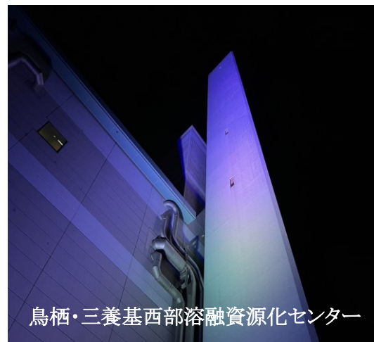
鳥栖・三養基西部溶融資源化センター